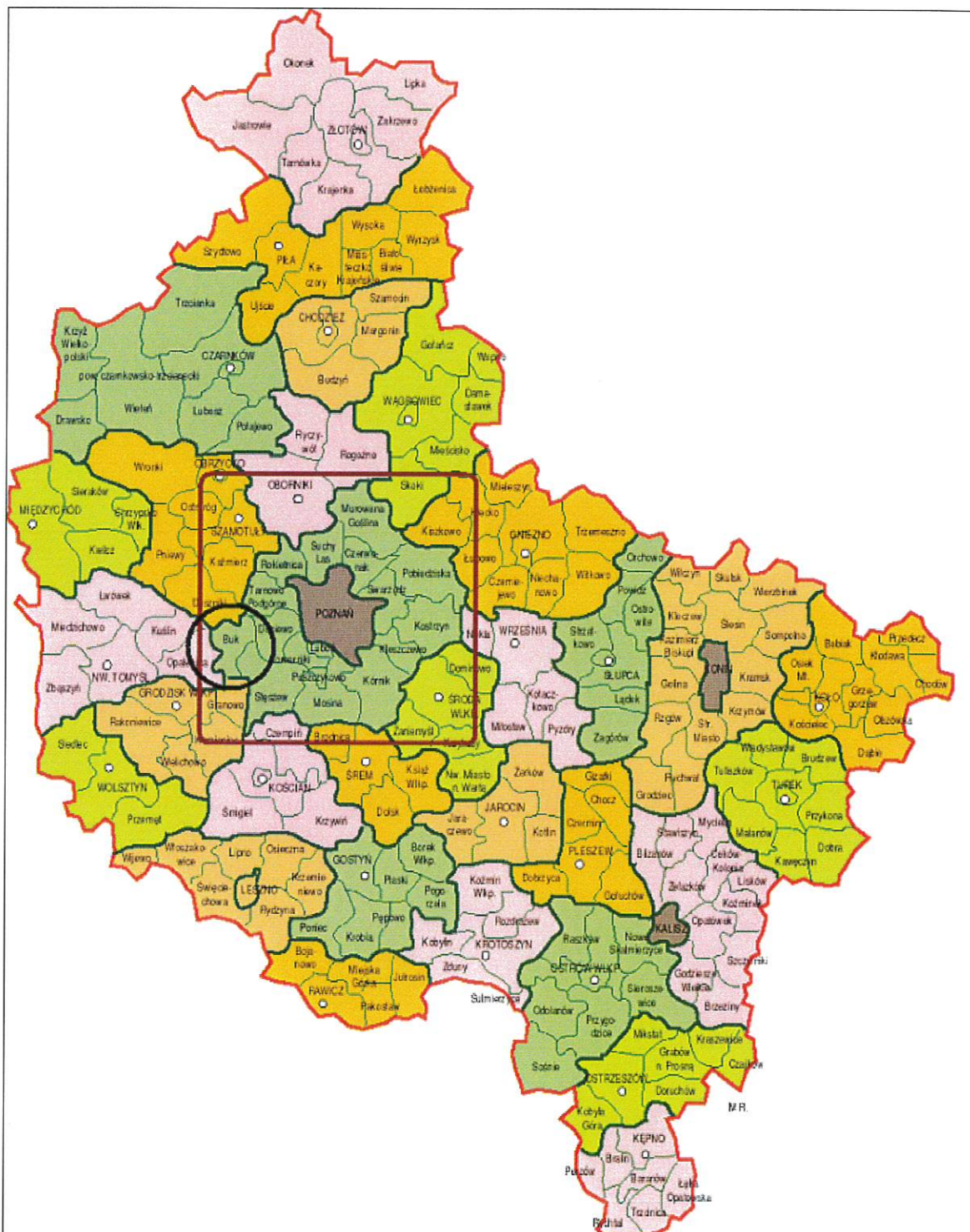
Mapa 3. Gmina Buk i Powiat Poznański na tle Województwa Wielkopolskiego