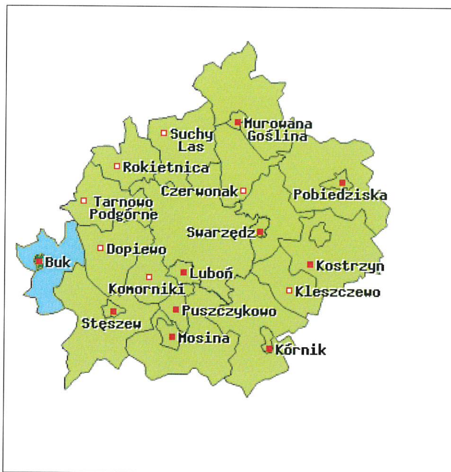
Mapa 2. Miasto i Gmina Buk na tle Powiatu Poznańskiego